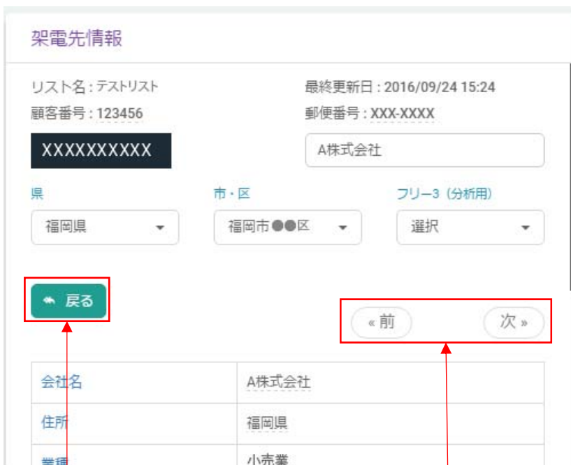
検索結果一覧に戻ります。

また、過去に架電したリストの場合その時のステータス・メモ・通話秒数・通話内容録音ファイルが確認できます。